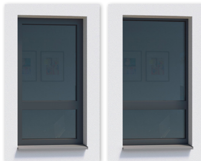
Bild 1: ARTLINE 82 mit verdecktem Fensterflügel – nur der Rahmen ist sichtbar Bild 2: Hier ist der Rahmen nahezu vollständig überputzt, es entsteht eine elegante Ganzglasoptik

Der Fensterflügel liegt vollständig hinter dem Rahmen verborgen und ermöglicht so einen hohen Glasanteil – und damit viel Tageslicht für die Innenräume